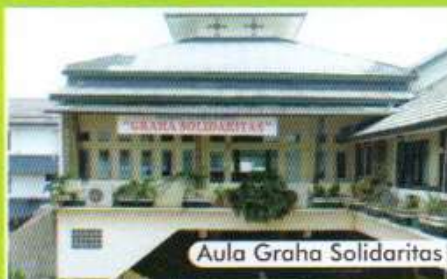
Aula Graha Solidaritas