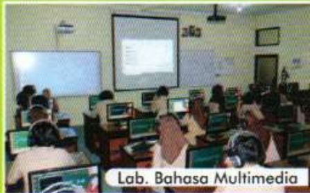
Lab. Bahasa Multimedia