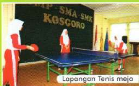
Lapangan Tenis meja